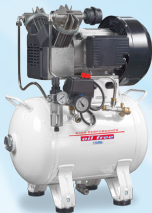
▲ P30 OF2 P