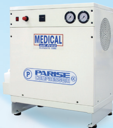
▲ P30 OF2 P-RES