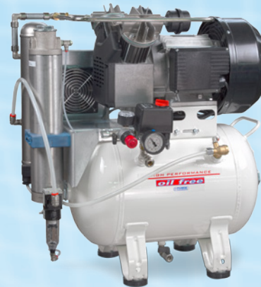
▲ P30 OF2 P-RE