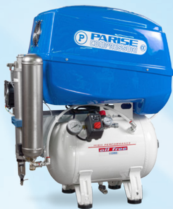
▲ P30 OF2 P-RE BoX