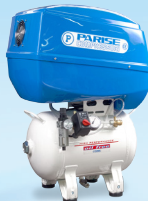
▲ P30 OF2 P BoX