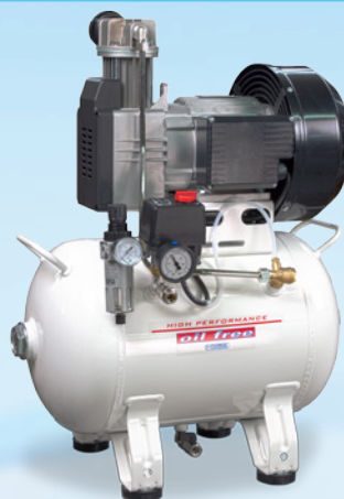
▲ P30 OF1 P