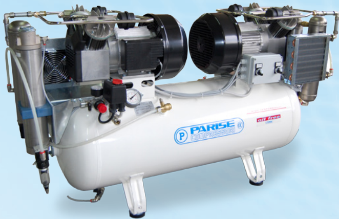
▲ P100 OF2 P-RET